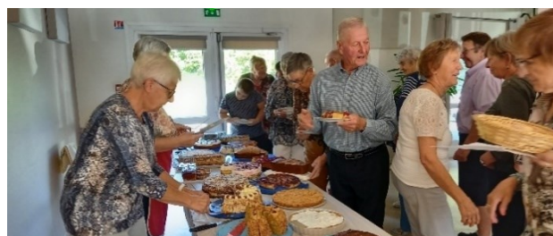
24 septembre : fête paroissiale à Thal, culte avec la participation des jeunes suivi du repas à la salle communale. Merci aux bénévoles ainsi qu'aux pâtisseries qui nous ont régales.