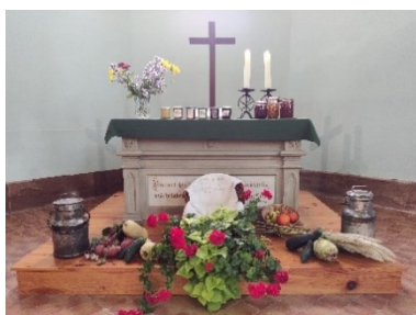
Culte des moissons le 8 octobre à Rexingen.

Si vous désirez la visite du pasteur n'hésitez pas à me contacter au 03.88.00.07.21 ou au 06.07.98.80.14 je viendrai avec grand plaisir.